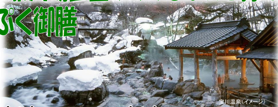
宝川温泉(イメージ)