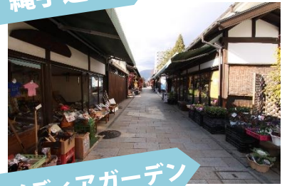
信毎メディアガーデン