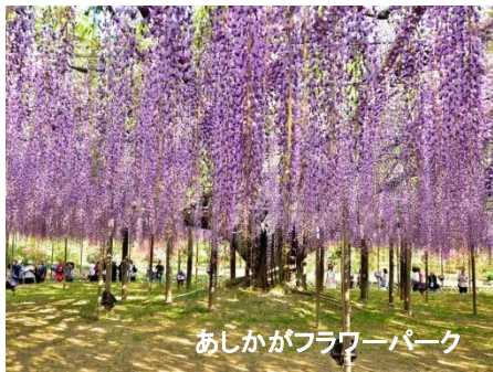
あしかがフラワーパーク