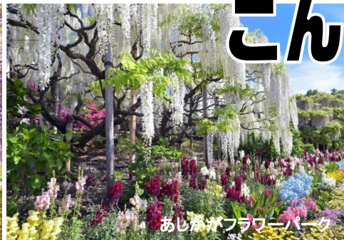
あしかがフラワーパーク