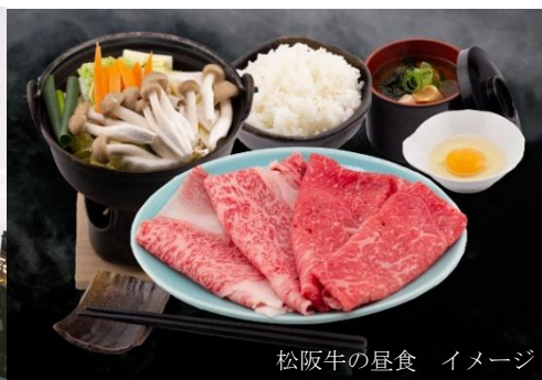
松阪牛の昼食 イメージ