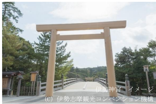
伊勢神宮 イメージ