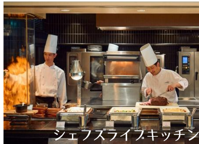
シェフズライブキッチン