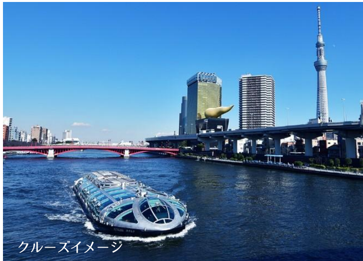
クルーズイメージ