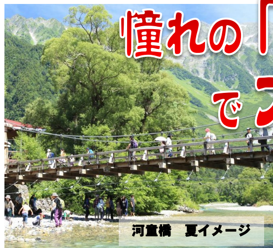
河童橋 夏イメージ