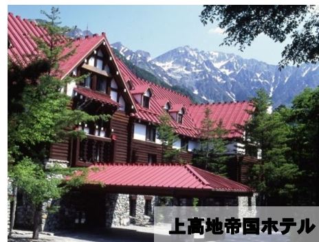
上高地帝国ホテル