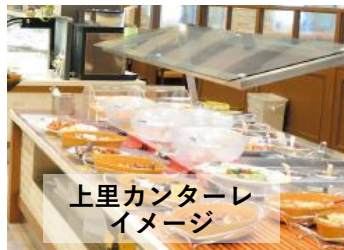
上里カンターレ イメージ

出発日 4月23日(水)・5月1日(木) 旅行代金 (お一人様) 14,800 昼食付 円