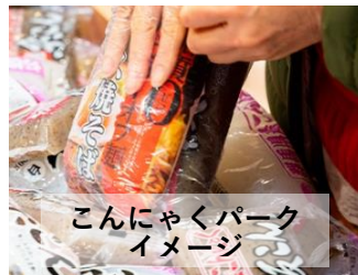
こんにやくパーク イメージ