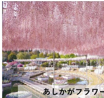
あしかがフラワーパーク イメージ