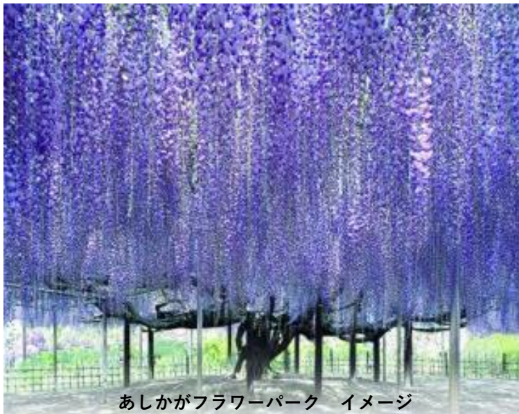
あしかがフラワーパーク イメージ