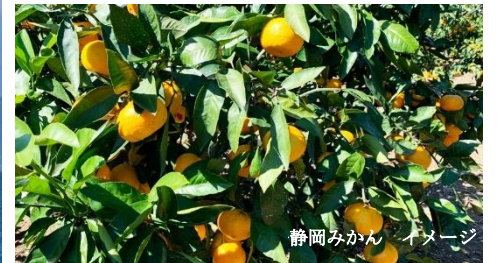
静岡みかん イメージ

出発日 10月14日(月・祝)・27日(日) 旅行代金 14,800 昼食付 11月9日(土) (お一人様) 円