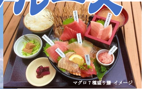
マグロ7種盛り膳 イメージ