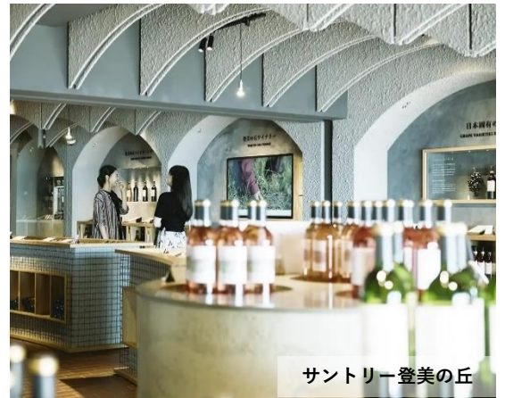
サントリー登美の丘