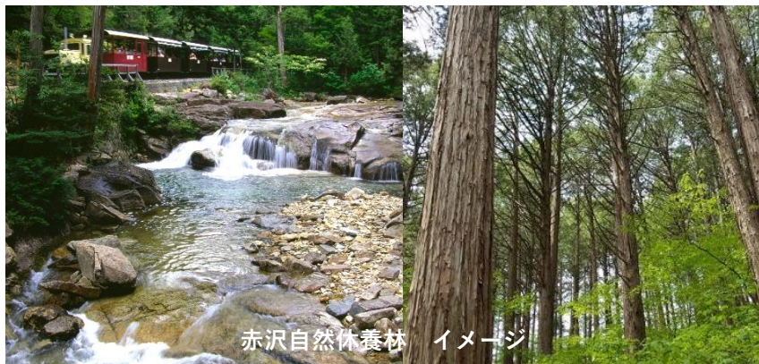
赤沢自然休養林 イメージ

出発日 7月12日(金)・9月7日(土) ご旅行代金 (お一人様) 13,800 昼食付 円