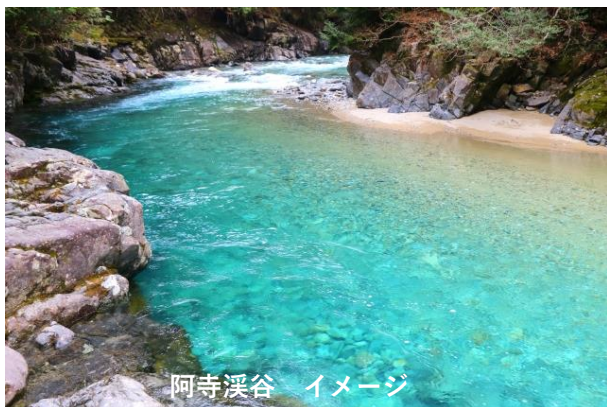
阿寺溪谷 イメージ