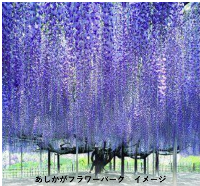
あしががフラワーパーク イメージ