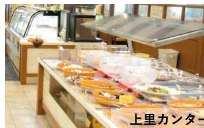
上里カンターレ イメージ