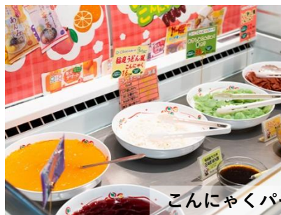
こんにやくパーク イメージ