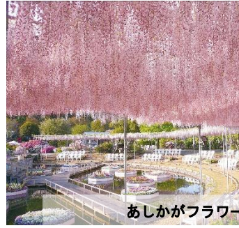
あしががフラワーパーク イメージ