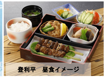
登利平 屋食イメージ

出発日 2026年4月22日(水)・27日(月) ご旅行代金 (お一人様) 16,200 昼食付 円(税込)