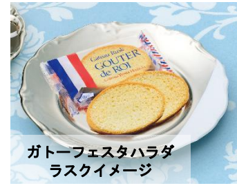
ガトーフェスタハラダ ラスクイメージ