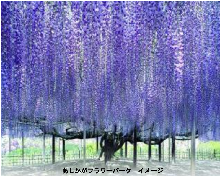
あしががフラワーパーク イメージ