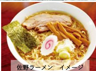
佐野ラーメン イメージ