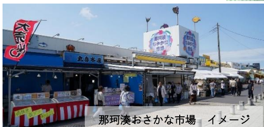
那珂湊おさかな市場 イメージ