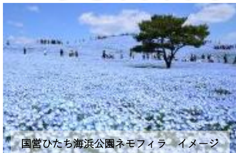
国営ひたち海浜公園ネモフィラ イメージ