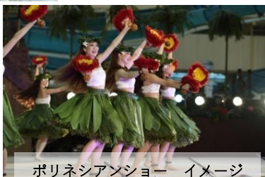
ポリネシアンショー イメージ