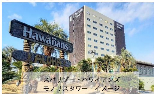
スパリゾートハワイアンズ モノリスタワー イメージ